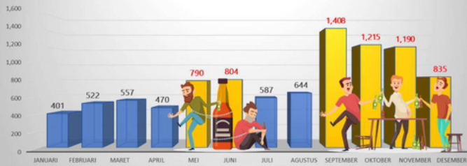
TREN DATA PELANGGARAN TAHUN 2022

9.423 KASUS PELANGGARAN TERJADI SEPANJANG TAHUN 2022