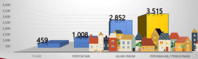
DATA LOKASI DENGAN JUMLAH PELANGGARAN TERBANYAK DAN DI ATAS RATA – RATA TAHUN 2022